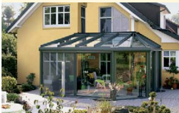
▲ weinor serres

Hoe u uw terras ook wilt gebruiken, weinor heeft het geschikte product voor u – zonnenscherm, terrassovertopping, Glasoase® en serre