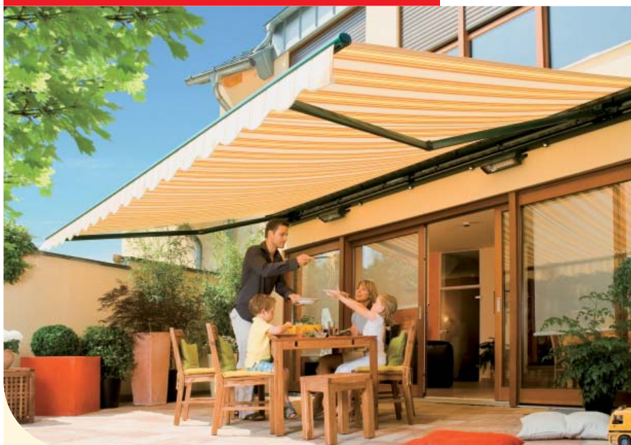
▲ weinor zonnenschermen